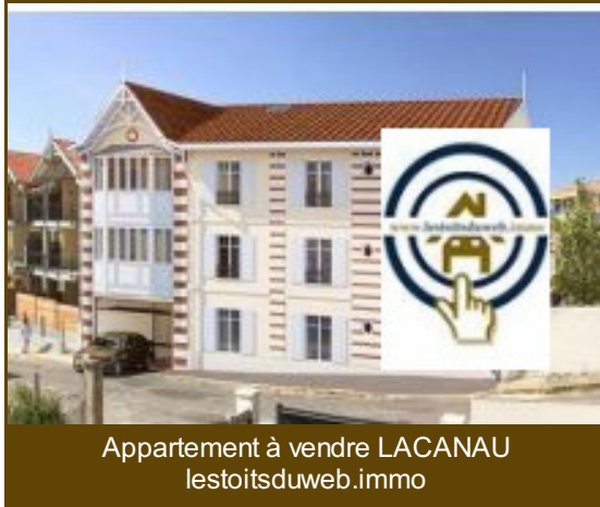
Appartement à vendre LACANAU lestoitsduweb.immo